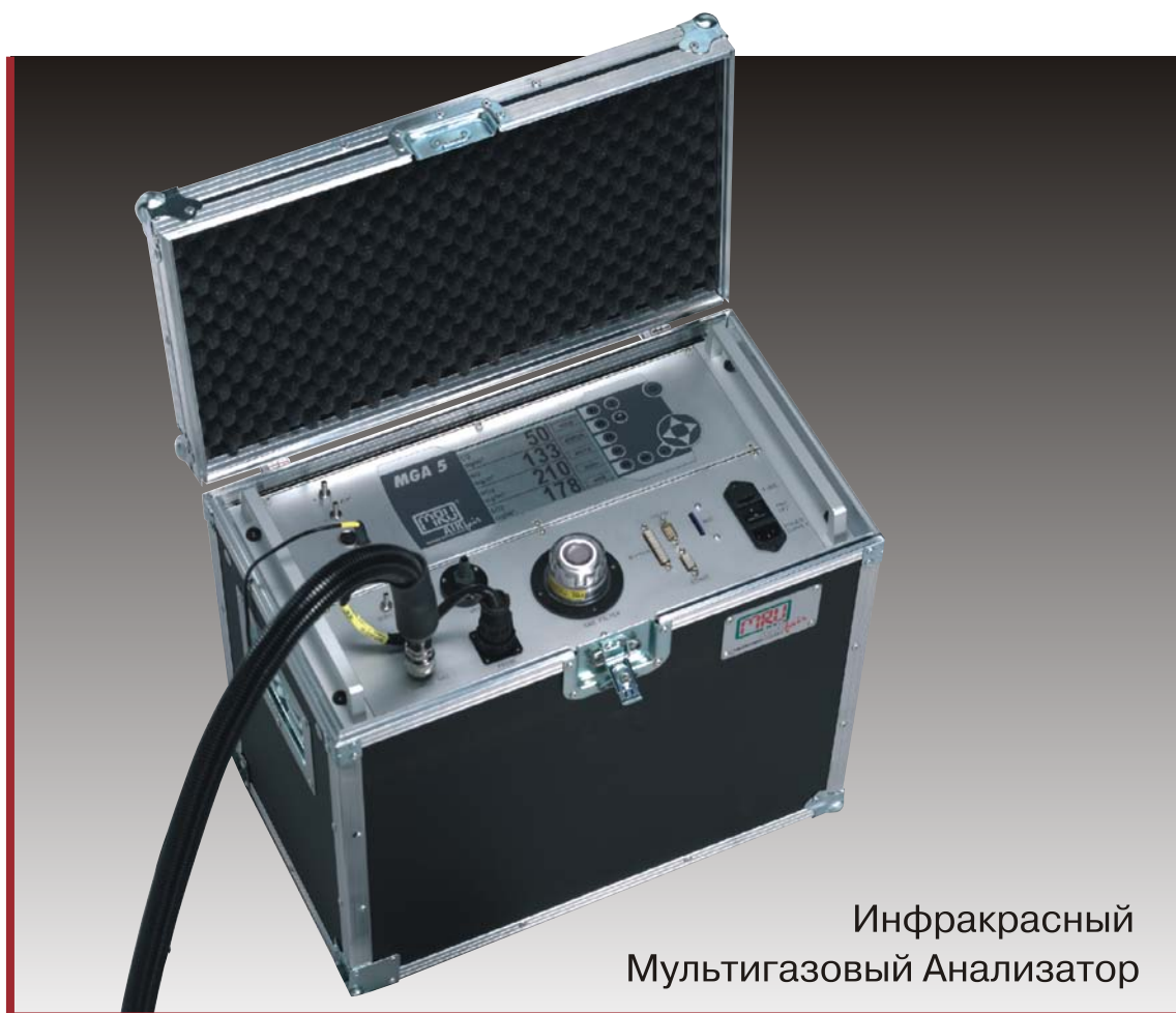
Инфракрасный Мультигазовый Анализатор